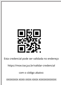
Feminino – verso